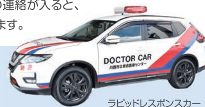
ラピッドレスポンスカー

重症患者様の早期介入を行うため、ラピッドレスポンスカーで現場に駆け付けます。医師、看護師、院内救急救命士がいつでも出動できるよう、専用のユニホームを着用し、緊張感をもって出動に備えています。消防本部から専用の端末に緊急の連絡が入ると、2分以内に出動します。